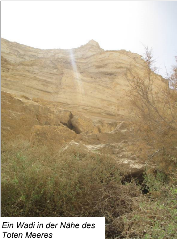
Ein Wadi in der Nähe des Toten Meeres

Alles was Odem hat, lobe den Herrn! AMEN