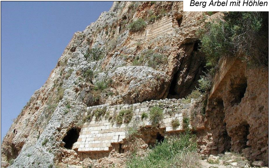
Berg Arbel mit Höhlen