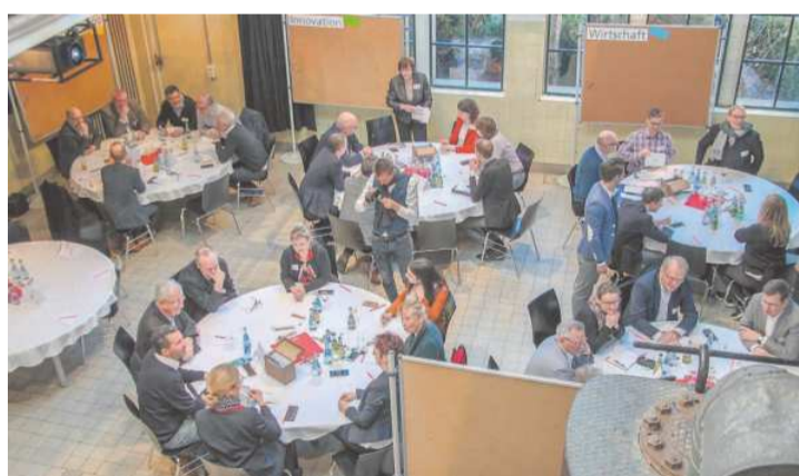
Über die Frage „Wofür steht die Region und wofür soll sie künftig stehen?“ wurde beim Markenbildungsworkshop der Wirtschaftsförderung Schwarzwald-Baar-Heuberg in Trossingen intensiv diskutiert.